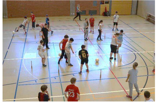
Wintersportlager 2015, Lenzerheide