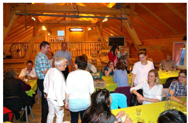
Personalfest Ende Mai 2015