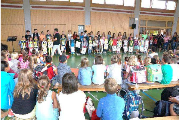
Erster Schultag Schuljahr 2015/16