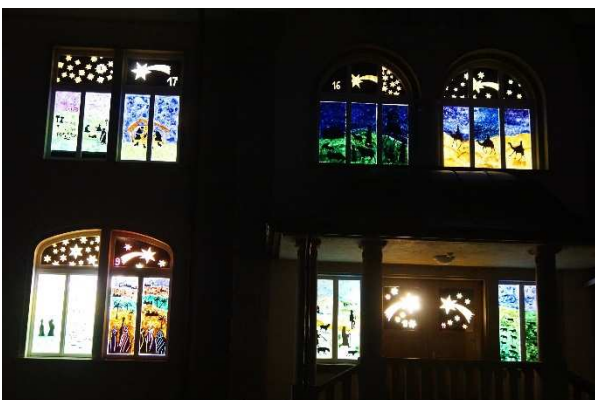
Adventskalenderfenster am Schulhaus 1911