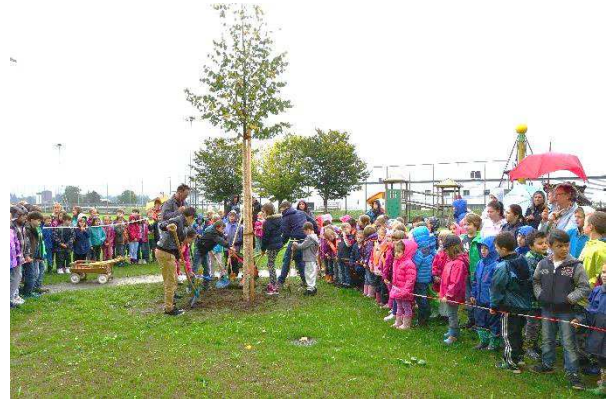
Pflanzen einer Winterlinde im Sept. 2015 nach Abschluss der Fassadensanierung